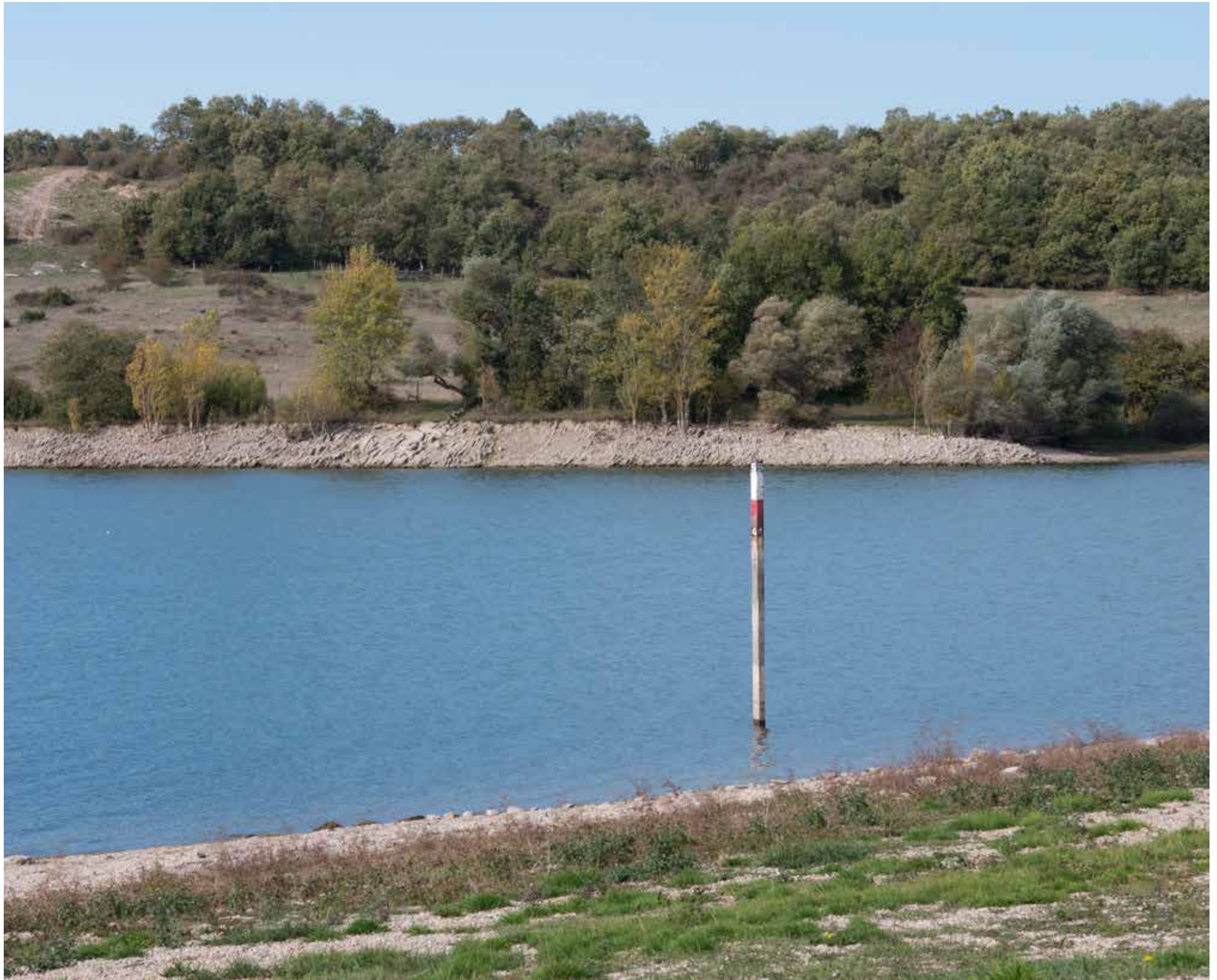
Las autoridades ejercen control en cada uno de los embalses

L uego de varios días de fuertes lluvias en Bogotá, el gobierno dijo que no hay que cantar victoria, aunque se ha incrementado el nivel de los embalses.