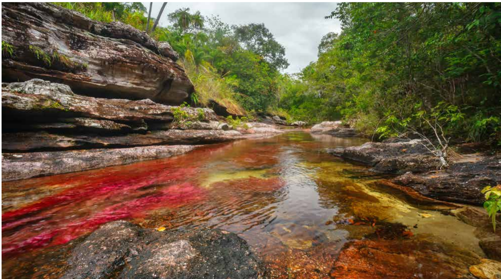
Caño Cristales.

E l presidente Gustavo Petro ha insistido en que Colombia tiene que tomar la vía de la reindustrialización, sobre todo en el campo, en la medida en que considera que Colombia debe convertirse en la despensa alimentaria del mundo.