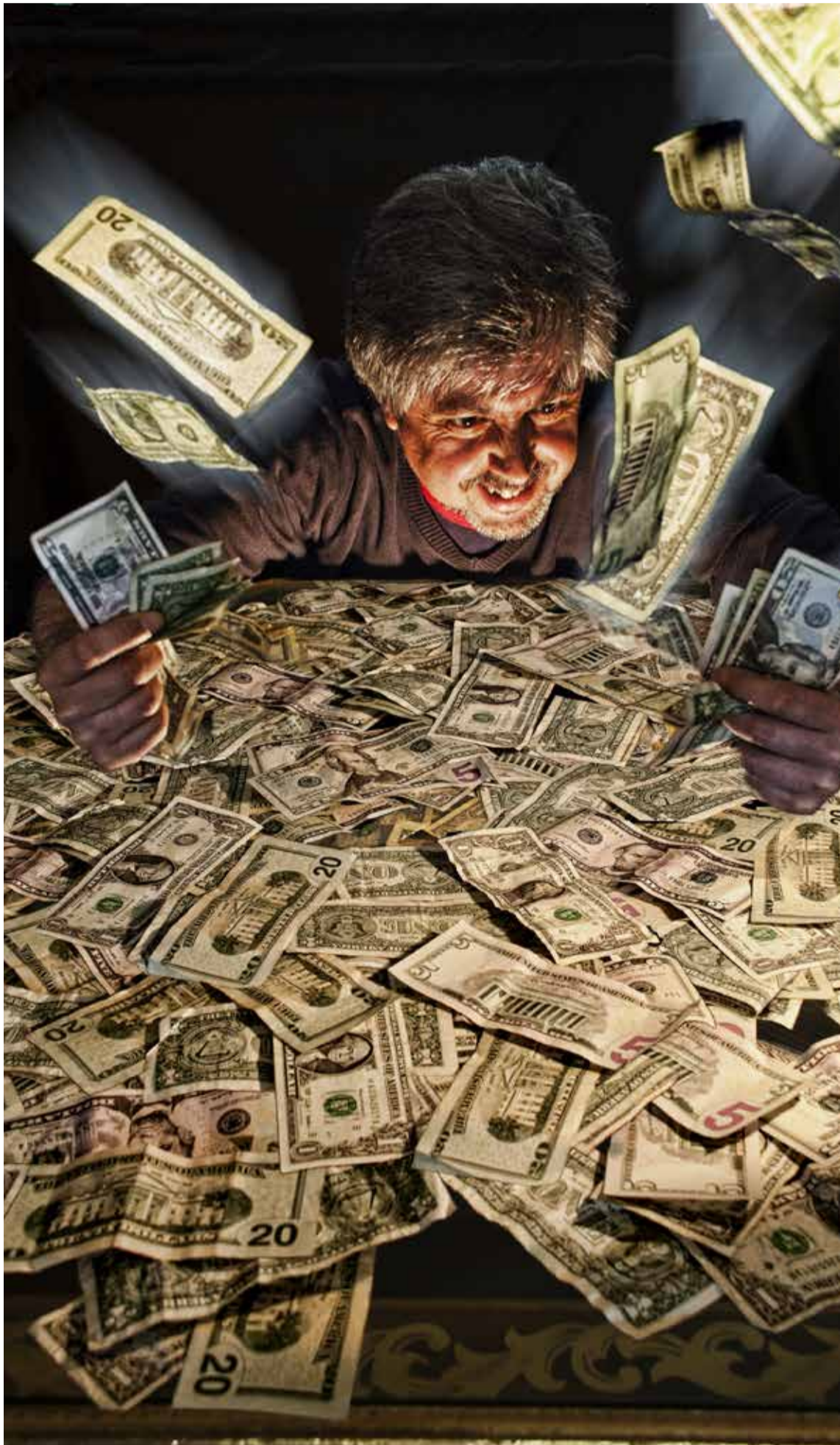
El dinero se gasta por montones

que normalmente se hace y evaluar que ese flujo de caja contemple esos gastos imprevistos, como parqueaderos, cenas, cumpleaños, regalos, etc.