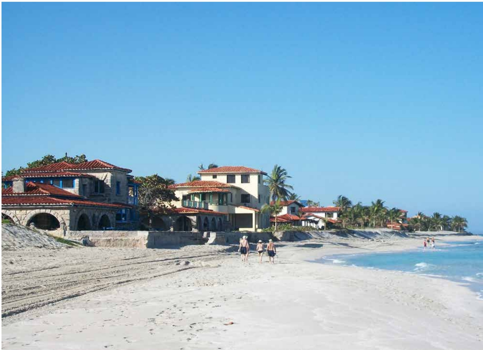
Casa de veraneo de Al Capone en Varadero.

posee más de 20 kilómetros de playas de arena e innumerables atractivos naturales. Destaca CamagüebaxCuba que la existencia del moderno y confortable aeropuerto internacional «Juan Gualberto Gómez» permite el desarrollo de vuelos directos desde