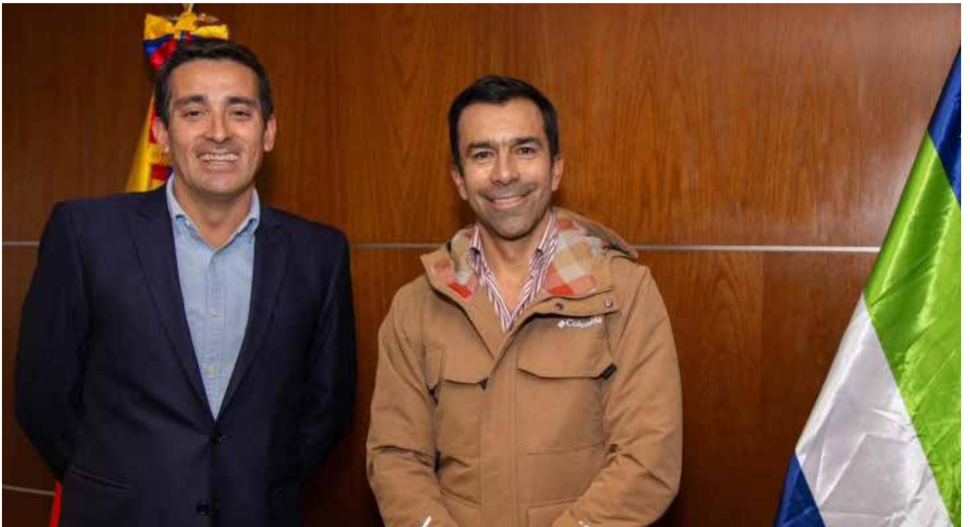
El gobernador de Cundinamarca Jorge Rey recibe en su despacho al representante en Colombia del Banco de Desarrollo de América Latina (CAF), Rodrigo Peñailillo.

E l representante en Colombia del Banco de Desarrollo de América Latina (CAF), Rodrigo Peñailillo, anunció la aprobación de 200 mil dólares en Cooperación Internacional, para la asistencia técnica en la estructuración del Fondo de Caminos Vecinales, denominado “Caminos para quedarse”.