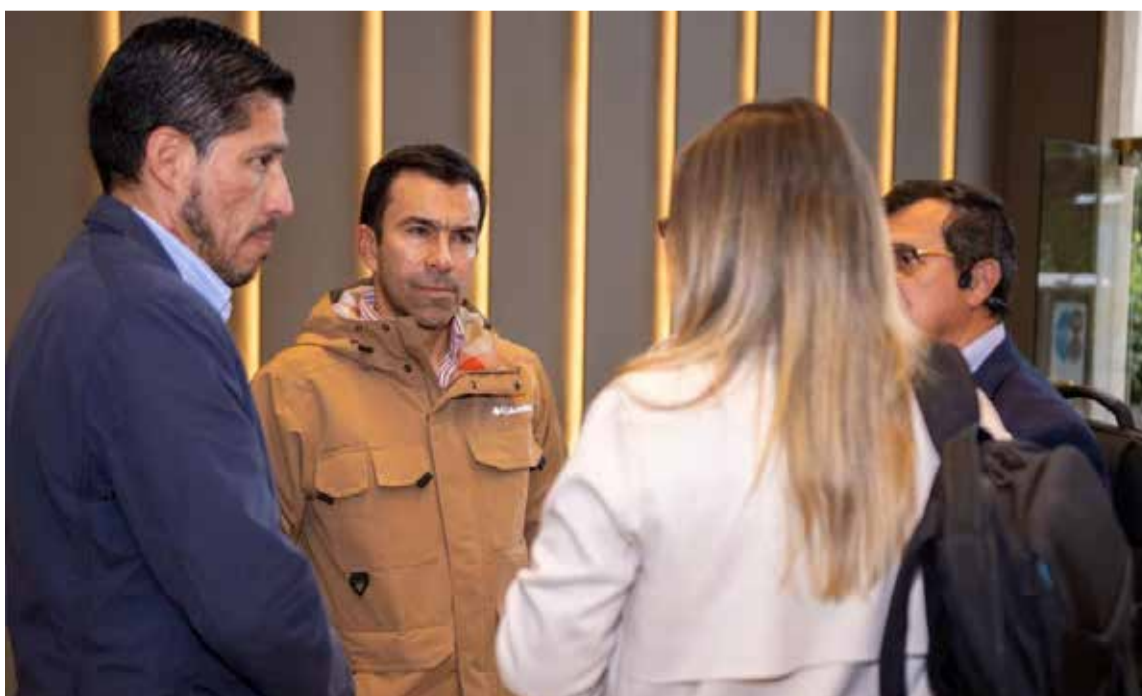
Expertos nacionales e internacionales, junto con el Instituto de Infraestructura y Concesiones de Cundinamarca – ICCU-, al término de la reunión.

«Recordemos que este gran proyecto busca mejorar 5.000 kilómetros