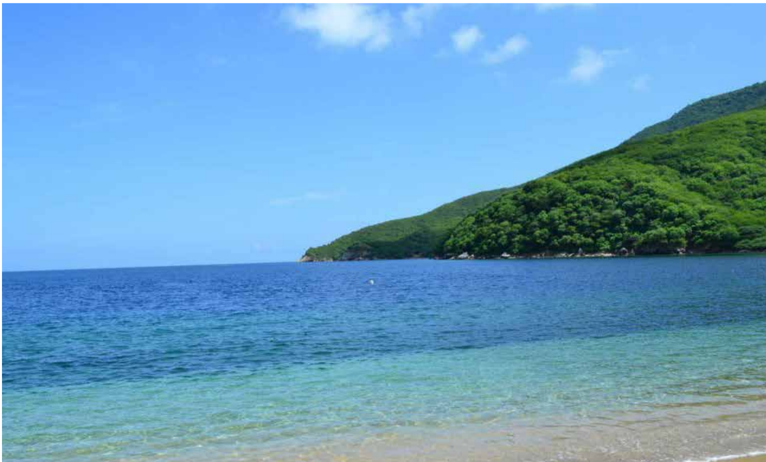
Bahía Concha Santa Marta, uno de los paisajes más bellos del mundo.

Colombia, tierra de contrastes y belleza incomparable, ofrece a sus visitantes la oportunidad de sumergirse en un viaje por la historia, la cultura, las fiestas y las tragedias que han marcado a sus pueblos exuberantes a lo largo de los siglos. El país se adentra en un rico y diverso patrimonio cultural que es un tesoro invaluable.