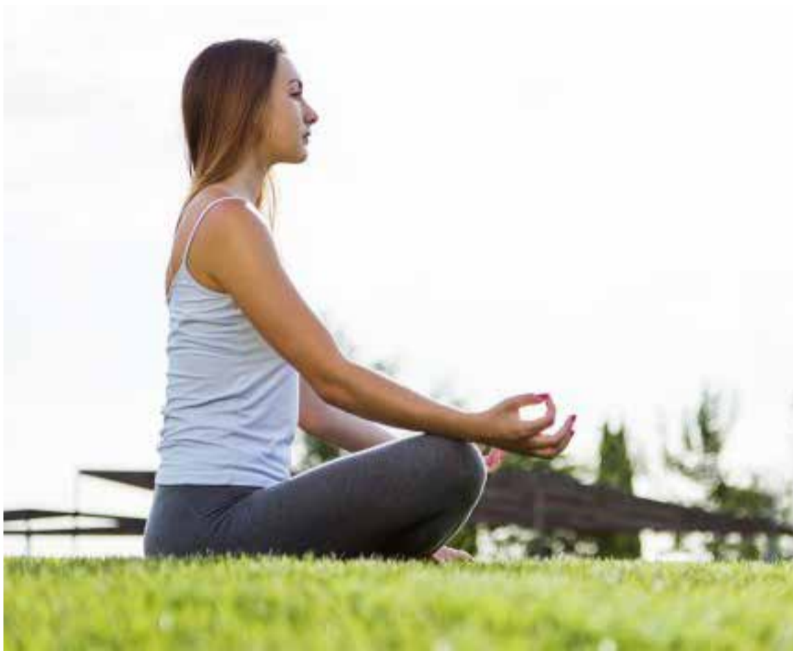
El proceso inmunológico nos protege de una serie de agentes externos que pueden afectar a nuestra salud.

Existen muchas formas de reforzar este sistema, no obstante, una correcta alimentación es la op-