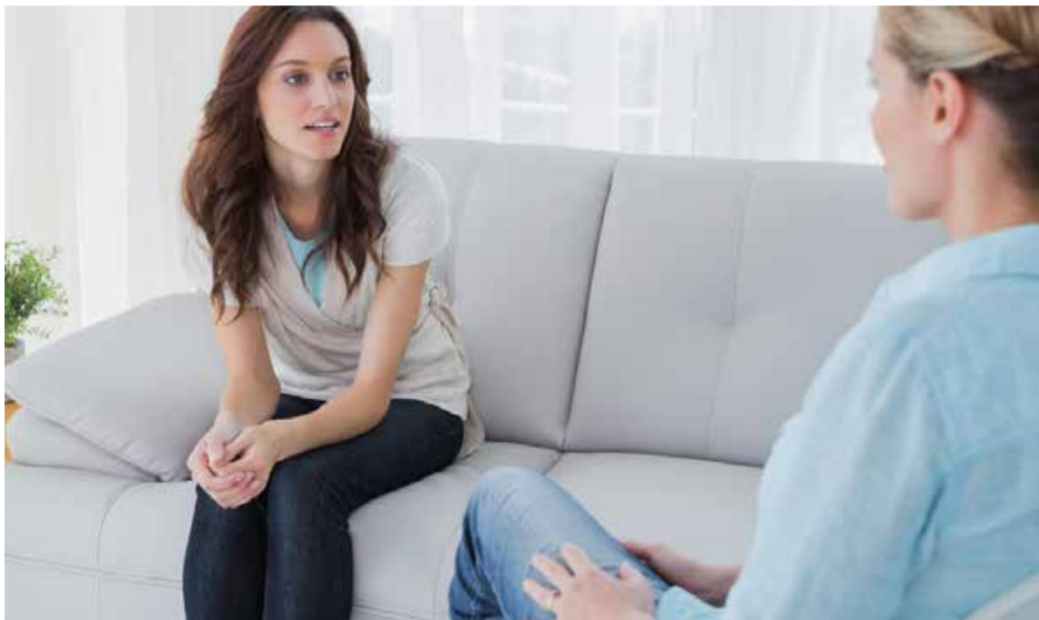
La madre tóxica es una mujer que ha llegado a la maternidad por caminos poco deseables, por convencionalismos.

Es un tabú de nuestra sociedad aceptar que hay madres que no quieren a sus hijas, pero es más real y frecuente de lo que nos gustaría reconocer. Como todo aquello que nos resulta difícil de aceptar y digerir, tendemos a negarlo. Pero existen, vemos a sus víctimas en consulta, peleando por llenar un agujero negro de infelicidad que arrastran desde la infancia y que, en la mayoría de las ocasiones, ni siquiera es consciente, porque duele nombrarlo.