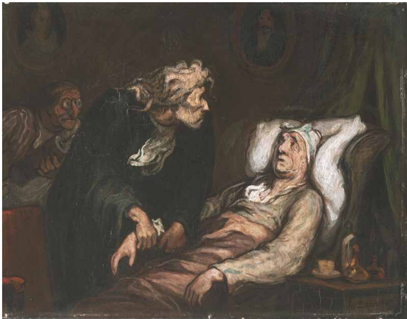
La hipocondría o hipocondriasis es una condición en la cual el paciente presenta una preocupación excesiva con respecto a padecer alguna enfermedad grave

Puede estar asociado con visitas frecuentes al médico, o puede implicar evitarlas por completo con el argumento de que se podría diagnosticar una afección real y muy posiblemente mortal.