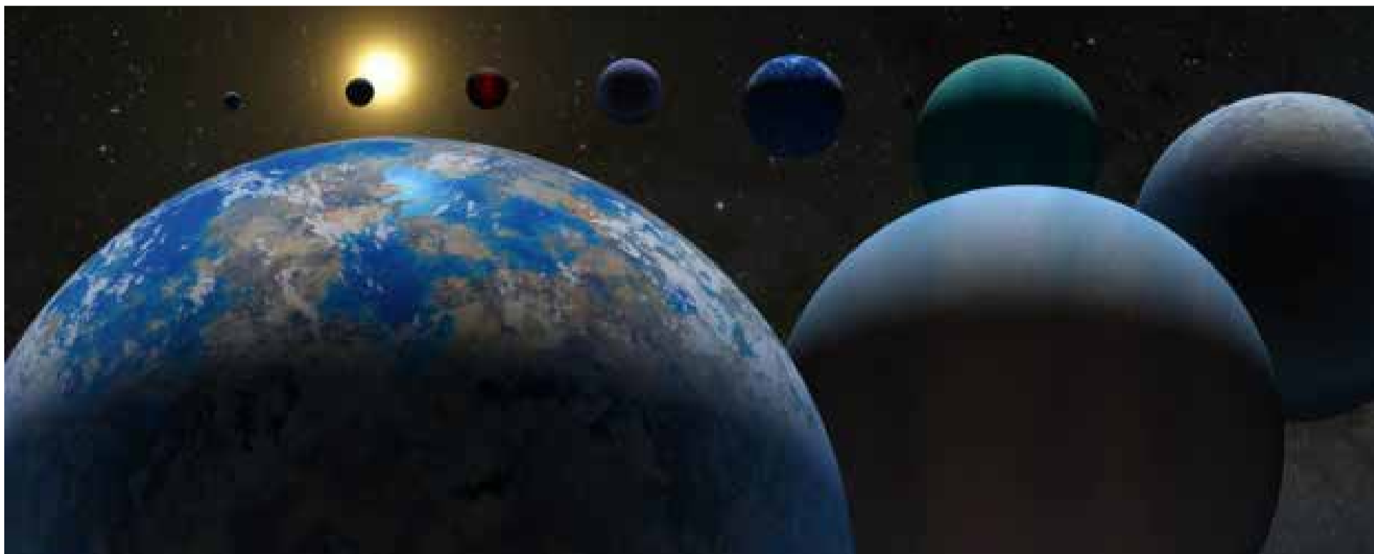
5.000 mundos descubiertos por la NASA

E l recuento de mundos fuera del Sistema Solar agregados al Archivo de Exoplanetas de la Nasa acaba de superar la marca de 5.000, tras un último lote de 65 incorporado el 21 de marzo.