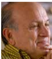
Gustavo Álvarez Gardeazábal

P ara quienes aprendimos a sumar y restar en un ábaco, los adelantos sentidos y sufridos durante los últimos 75 años nos insensibilizaron al progreso, nos anularon la capacidad de sorprendernos y nos crecieron las ganas de ser cada vez más cómodos.